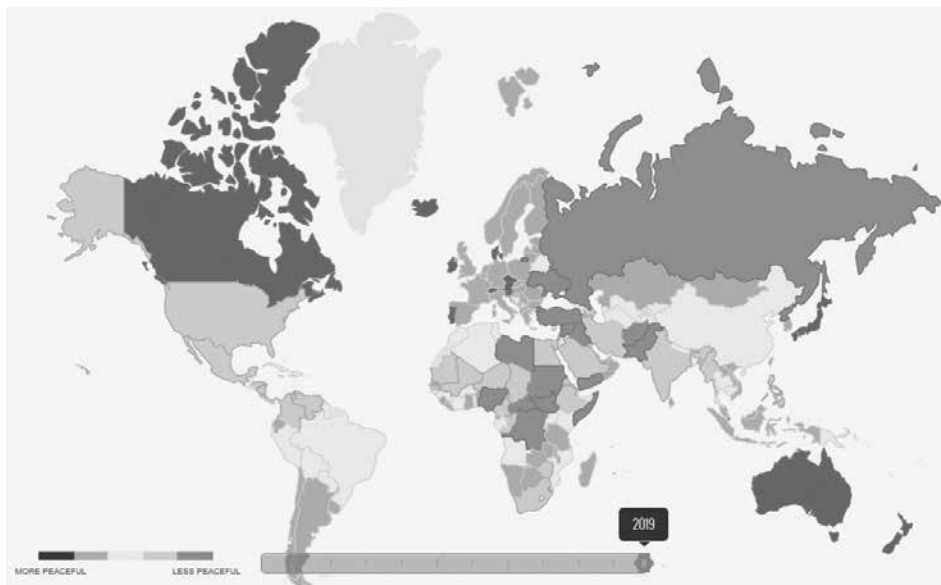
Obrázek č. 2: Grafické znázornění státních aktérů dle hodnocení GPI (2019) 9

Komplexní řebříček hodnocených státních aktérů, včetně příslušného bodového ohodnocení a komparační změny oproti předcházejícímu roku je uveden v následujících tabulkách.