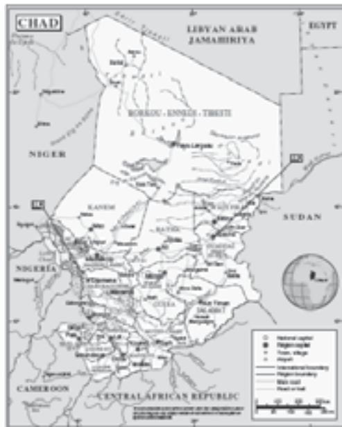
Obr. 2: Čad – Čadská republika

Konflikt v této části Afriky se začal rozvíjet přibližně v roce 2003 v západní části Súdánu zvané Dárfúr. Postupně se situace zhoršovala, často docházelo k ozbrojeným střetům o ovládnutí této oblasti mezi vládními jednotkami, různými skupinami rebelů a rodovými kmeny. Většina obyvatel Dárfúru uprchla do jiných oblastí, řada z nich překročila hranice do relativně klidnějšího a bezpečného Čadu. Celkový počet uprchlíků z Dárfúru za celou dobu konfliktu se odhaduje na dva miliony.