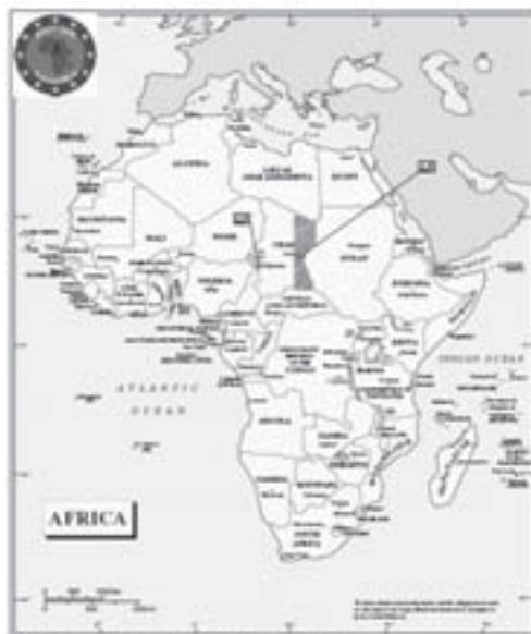
Obr. 1: Čad – stát ve vnitrozemí střední Afriky

Čad bývá také často nazýván „Zapomenuté srdce Afriky“. Má necelých 10 milionů obyvatel, z nichž polovina je mladší 15 let. Je to bývalá francouzská kolonie, která získala samostatnost v roce 1960. Od té doby jde o velmi nestabilní, nepokoji zmítanou zemi, údajně s největší korupcí na světě. Nedávno tu byla objevena bohatá ložiska