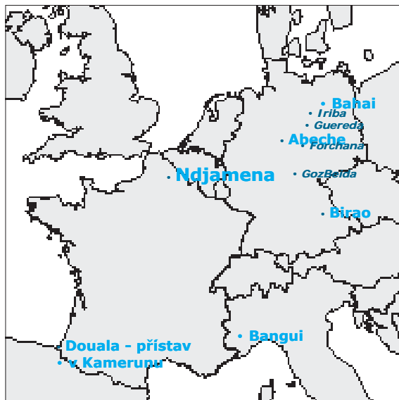
Obř. 3: Porovnání vzdáleností Čad – Evropa