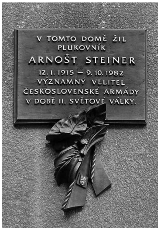
Pamětní deska Arnošt Steiner. Umístění: Brno, Kladivova 548/5, Brno, Černá Pole