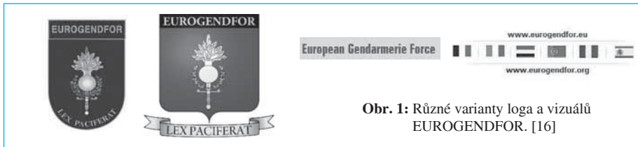
Obr. 1: Různé varianty loga a vizuálu EUROGENDFOR. [16]