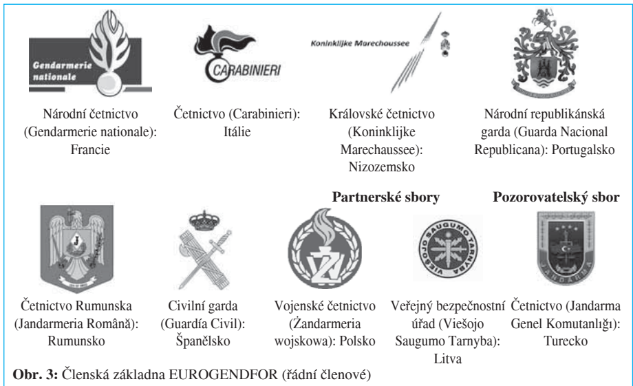
Obr. 3: Členská základna EUROGENDFOR (řádní členové)