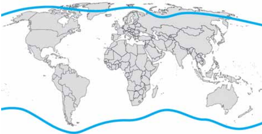
Obr. 2: Možný prostor nasazení příslušníků OS ČR.

Operace, jichž se budou příslušníci ozbrojených sil ČR zúčastňovat, mohou probíhat ve značné vzdálenosti od ČR, kdy účast těchto sil v principu není, vyjma arktických oblastí, geograficky omezena. Operace budou probíhat v různých operačních prostředích a ozbrojené síly se budou muset rychle přizpůsobovat proměnlivému vývoji operací, zahrnující operace vysoké intenzity, letální i neletální způsob vedení boje se širokou škálou různých stabilizačních, mírových, podpůrných nebo humanitárních aktivit, vyžadujících rozmanitý soubor schopností.