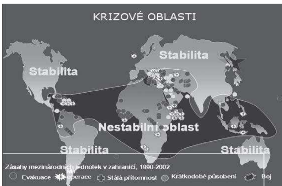
Obr. 3: Schéma krizových oblastí

Současným trendům je společná skutečnost, že spektrum ohrožení a nebezpečí pro nějaký suverénní stát je zvýrazněno třemi znaky: dynamikou, komplexností a sníženým významem geografického prostoru.