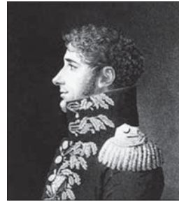
Obr.: Antoine-Henri Jomini

Podle Jominiho nebyl operační směr pouhým vztahem mezi vojskem a jeho skladišti. Správné určení operačního směru vnímal jako „uchopení se iniciativy vojskem“, které se zmocnilo rozhodujících bodů kontrolovaných protivníkem. Jominiho to vedlo ke srovnání relativních výhod a nevýhod vlastních operačních směrů v čase, prostoru a koncentraci sil vzhledem se směry protivníka. Metodou indukce (pozorováním a zkušenostmi) pak rozvinul vlastní koncepci vnitřních a vnějších operačních směrů.